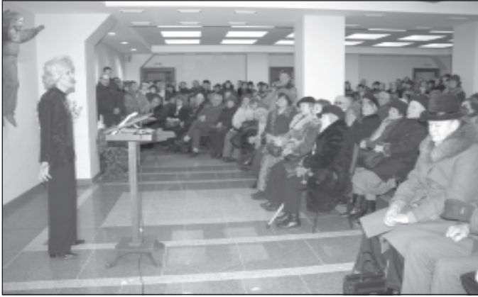
Atkelta iš 3 p.

12 val. atlaides papuošė 2008–2009 m. projekto „Dialogas – žodis ir spalva“ pirmasis renginys. Į konferencijų salę susirinko gausus būrys parapijiečių, ištroškusių išgirsti gerą žodį, patirti sielos atgaivą atitrukus nuo kasdieninių darbų.